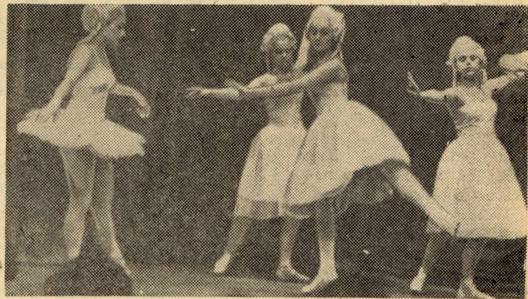
Выступает балетная студия института.