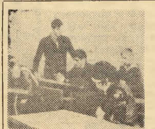
ОТЧЕТЫ И ВЫБОРЫ В КОМСОМОЛЕ

Первый курс — самый трудный. Неудачи, конечно, были. И вот, когда им не помогали ни