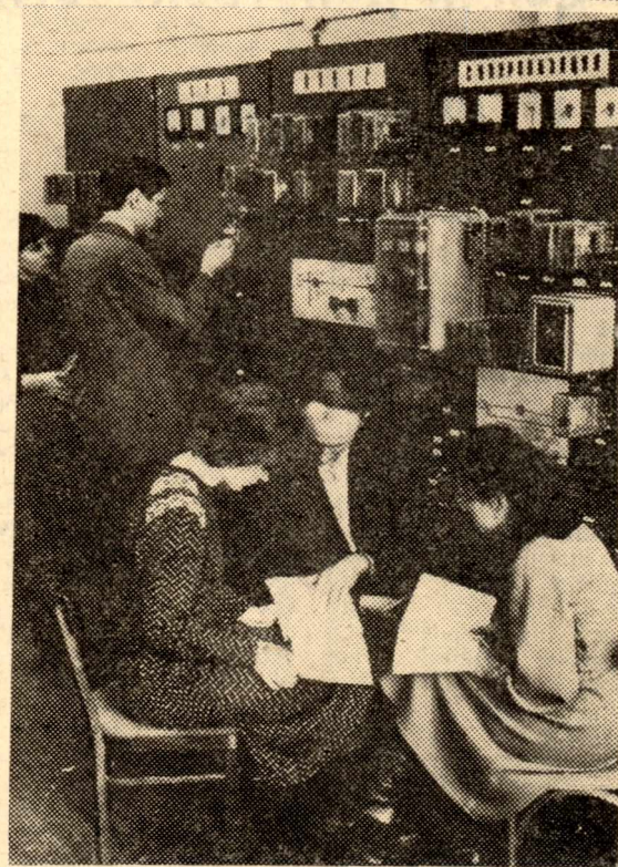
МАИ — ПОРА ЗАЧЕТОВ, ПОДГОТОВКИ К ЭКЗАМЕНАМ.

Ректорат и партком обязаны коренным образом улучшить работу с кадрами, добиться того, чтобы все участки учебной, научной, хозяйственной работы возглавлялись политически зрелыми, профессионально подготовленными и трудолюбивыми людьми, способными организаторами и воспитателями студенческой молодежи. Создать обстановку нетерпимости к тем, кто нарушает партийную дисциплину, злоупотребляет служебным положением, допускает аполитичность и отступление от норм этики советского ученого, халатно относится к выполнению служебных обязанностей.