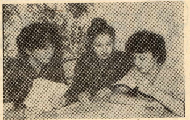
Здоровье студентов — ее забота

ЗВЕНИТ звонок... Перебив. Минута, другая — и в профсоюзный студенческий комитет один за другим заходят студенты-активисты.