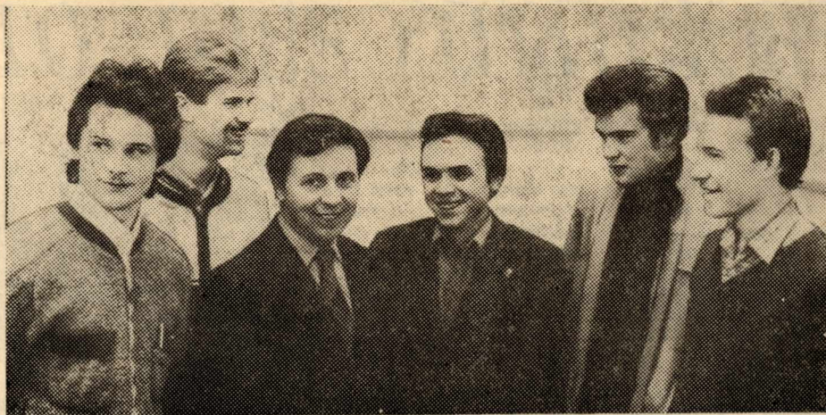
КУРАТОР ДЕЛИТСЯ ОПЫТОМ

Студенческая жизнь чрезвычайно многообразна, но главное в ней — учеба. Учитывая это, уже с первых дней перед первокурсниками необходимо ставить такие конкретные задачи, которые должны быть обязательно решены.