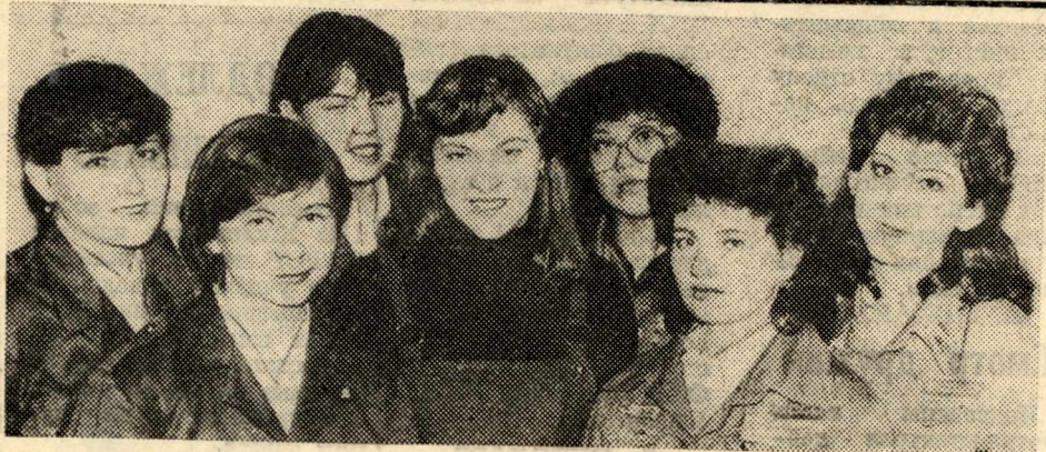
НА СНИМКЕ: агитбригада «Электры».