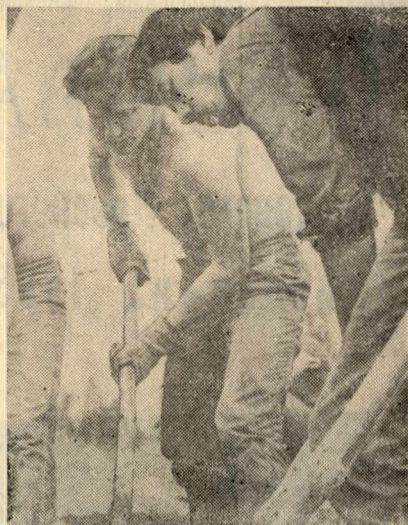
НА СНИМКАХ: студенты создают партизанские землянки и благоустраивают территорию мемориала в селе Верховье Холм-Жирковского района.