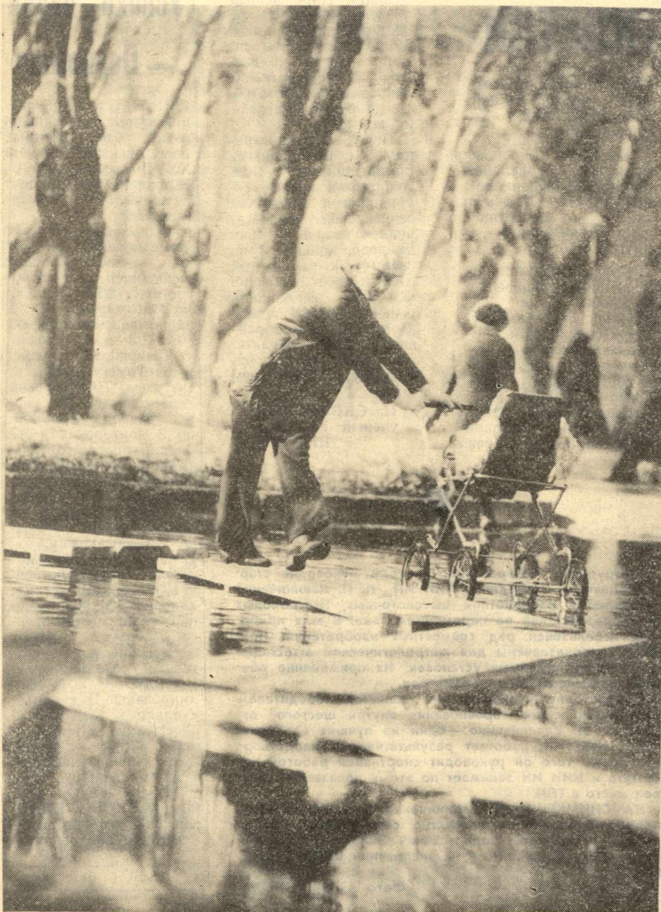
Фотоэтиюд А. Батурина