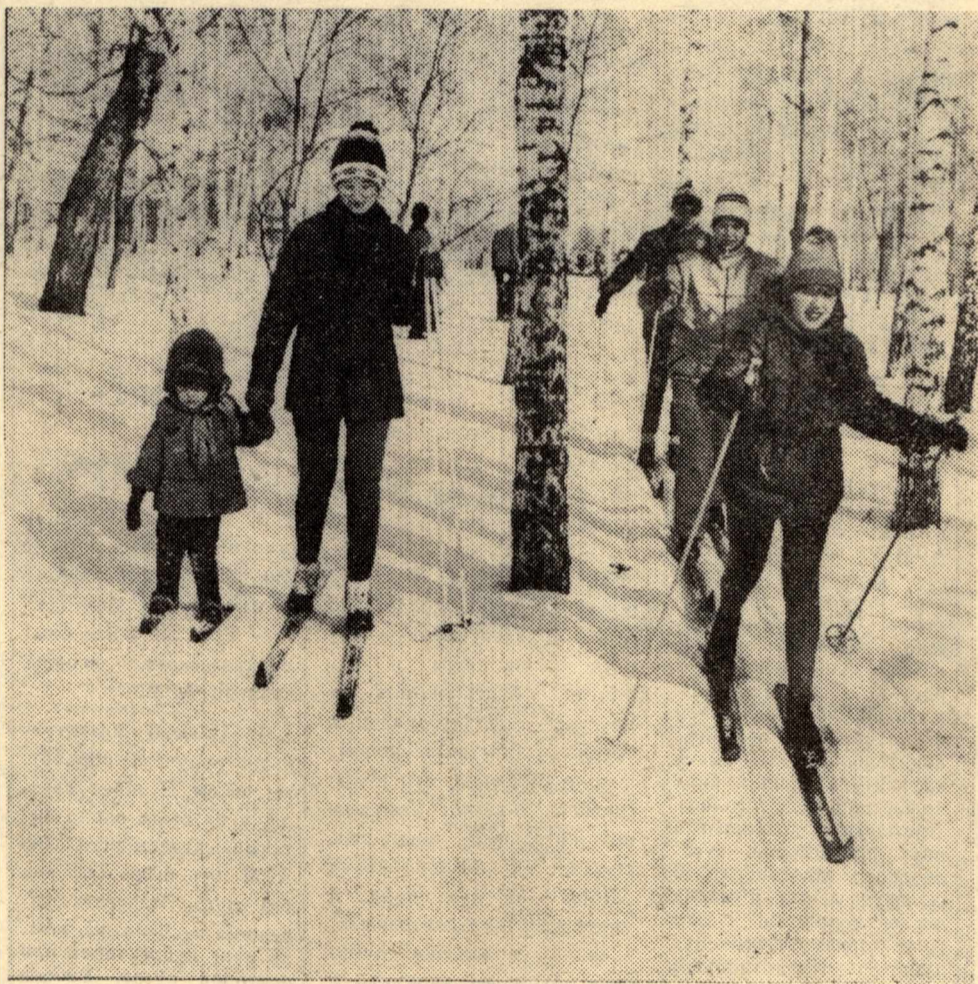
ОТКРЫТИЕ ЛЫЖНОГО СЕЗОНА.