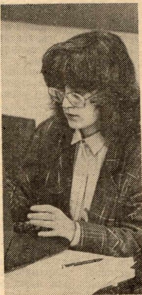
Наедине с задачей. Фотоэтиюд А. Петрова.

О вопросах студенческого самоуправления, студенческой самостоятельности — и в учебе, и в быту — говорят сейчас много. Практически на каждом собрании — с какой бы повесткой оно ни сражалось. Причем мнения о том, необходимо ли это движение и в какой мере, разделились, не зря же многие преподаватели иронично называют его «самоуправством». Как чувствуют себя студенты в условиях самоуправления? Какие проблемы их волнуют?