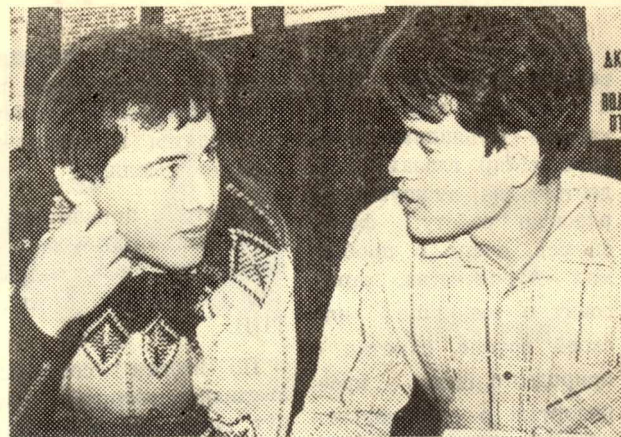
Одна из лучших рот оперативного отряда ТПИ — коллектив факультета автоматизации и вычислительной техники.