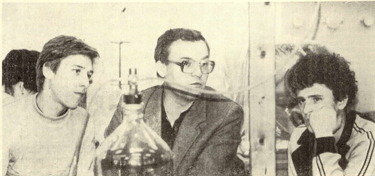
Разговор по существу