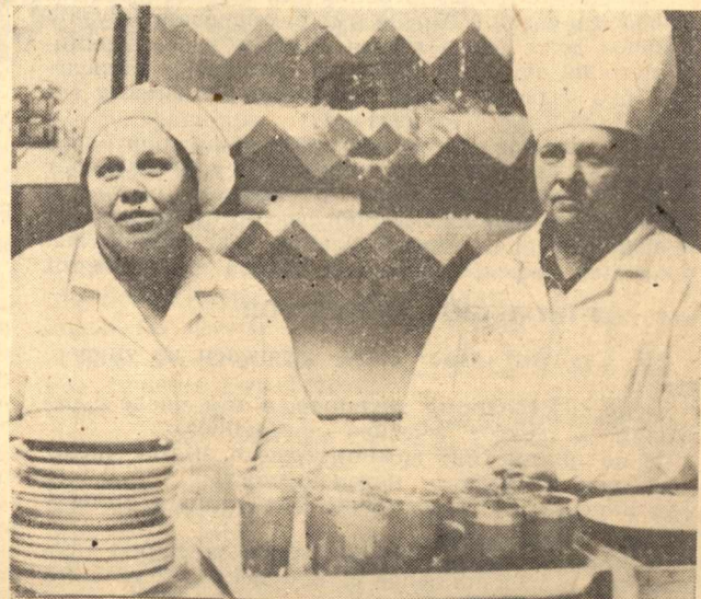
А ЦЕНЫ НЫНЕШНИЕ ВЫ ЗНАЕТЕ?