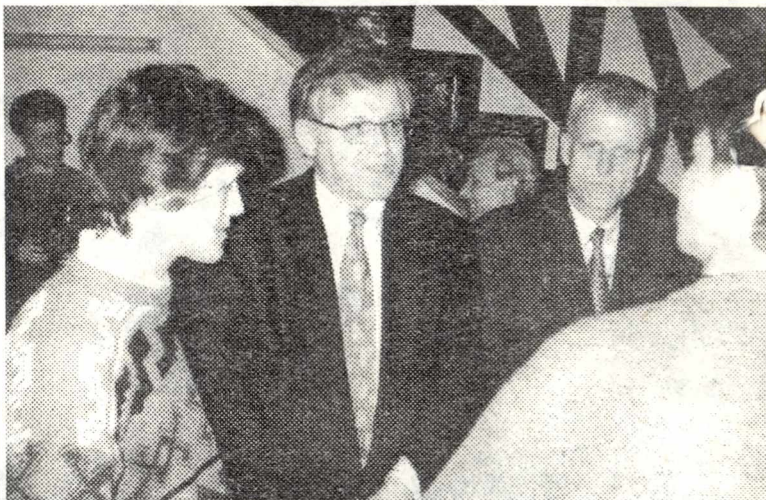
На снимке: во время встречи студентов РНЦ с ректорами вузов Германии.

Произошли изменения и в учебном плане. Усилиями сотрудников и методистов центра разработана новая программа преподавания немецкого языка. В ТПУ создан учебно-методический комплекс «Немецкий язык». Уже с нового учебного года все первокурсники политехнического, изучающие немецкий язык, перейдут на новую систему обучения иностранному языку.