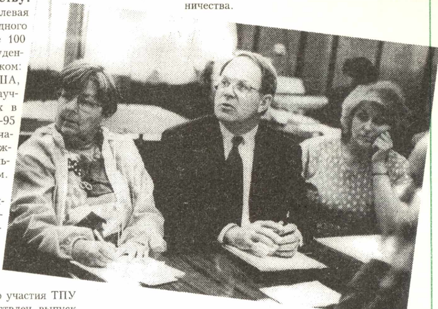
На снимке: встреча с американскими профессорами

3. Пусть наступающий Новый Год будет лучшим из тех, когда Томск и ТПУ стали открытыми для международного сотрудничества.