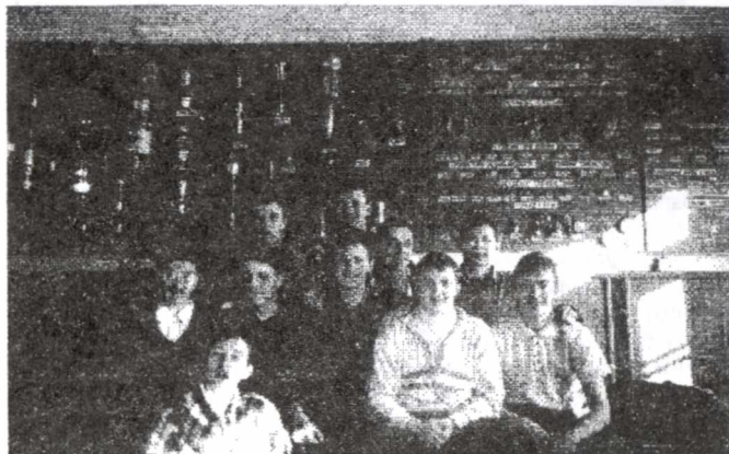
Группа 1А43, ЭФФ.

И вместе с тем они как дети. Весна кружит головы, мучает сердца, подталкивает на безумства. На днях один юноша распахнул окна в аудитории ТПУ и восторженно