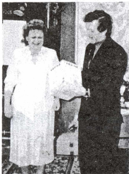
Награждение победительницы. Первый приз - чайник.

И вот этот день - 6 марта - настал. Призы подготовлены, стол накрыт, звучит легкая музыка, участницы рассаживаются по местам, болельщики, ведущий