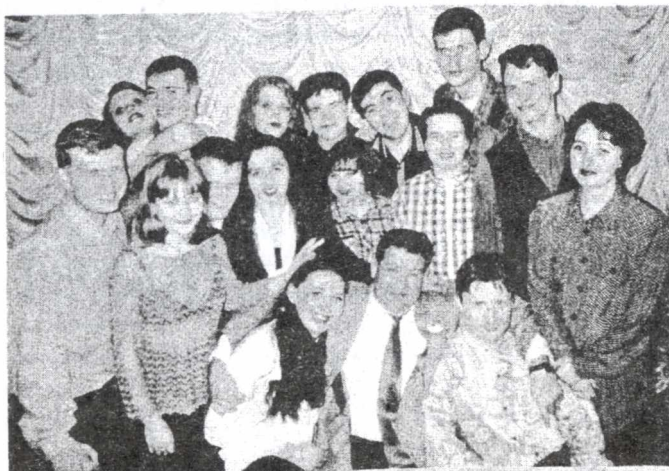
Команда ТПУ "ПОЛИГОН".

- Ну да. К двадцать третьему февраля делали.