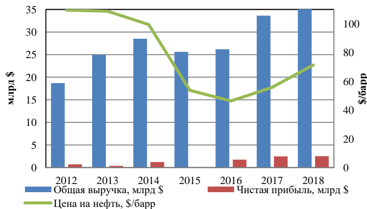
Рис. 2 Анализ выручки и чистой прибыли

объемы продаж. Пикового значения выручка от реализации достигла в 2018, и составила 46 млн. канад. долл [1]. В рассмотренном периоде общий объем капиталовложения оставался приблизительно на одном