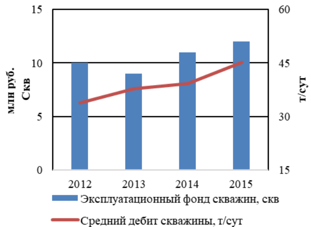
Рис. 1б Эксплуатационный фонд скважин

Вместе с тем, снижение мировых цен на нефть может неблагоприятно сказаться на деятельности Общества, в первую очередь, за счет снижения выручки от продаж, снижения эффективности деятельности и, как следствие, сокращение инвестиций в развитие Общества. Общество затрудняется прогнозировать возможность существенного изменения цены на нефть в связи с волатильностью рынка. Согласно годовым отчетам компании эксплуатационный фонд скважин падает в 2012-2013 гг., затем снова возрастает в 2014-2015 гг. (рис.1б). Средний дебит напрямую зависит от эксплуатационного фонда скважин, за исключением 2013 года, в котором средний дебит возрос, не смотря на уменьшение эксплуатационного фонда, можно предположить, что динамика среднего дебита новой скважины будет повторять динамику эксплуатационного фонда.