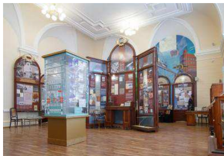
Музей истории ТПУ

На мою ректорскую долю выпала возможность решать столь масштабные и трудные задачи. Отчетливо осознаю свою ответственность перед предыдущими поколениями политехников и перед поколениями будущими. И я буду делать для этого все возможное и невозможное, опираясь на сильный коллектив университета.