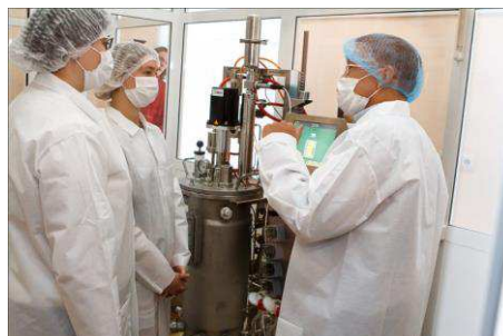
Научные исследования в Научно-образовательном центре «ТПУ – Р-Фарм»

Естественно, с развитием технологий хочется, чтобы эти