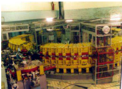
Крупнейший электронный синхротрон, созданный в ТПУ

В ТПУ создан научно-образовательный центр для подготовки элитных специалистов для научно-исследовательской и инновационной деятельности в таких областях, как радиационные технологии, обращение с отработанным ядерным топливом, проектирование, эксплуатация ядерных энергетических установок, создание новых материалов ядерной техники. В Центре начали подготовку специалистов в рамках российско-вьетнамского проекта по подготовке специалистов для атомной отрасли.