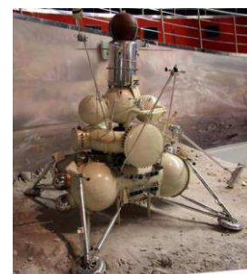
Луноход «ЛУНА-24» с турбобуром и заборным устройством для отбора лунного грунта

Учёные института сыграли активную роль в организации Западно-Сибирского (ЗСФ), Томского и Новосибирского филиалов СО РАН. Основной научный и инженерный потенциал в ЗСФ АН был представлен преимущественно томичами. Серьезное влияние университет оказал на развитие образования, науки и