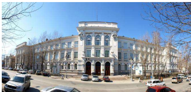
Национальный исследовательский Томский политехнический университет (главный корпус)

• продвижение лидеров отечественного образования в группу университетов мирового уровня.