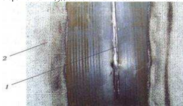
Рис.1. Корневой шов, выполненный процессом STT 1 — шов; 2 — термозащитный пояс.

Сварка корневых швов стыков труб традиционно является наиболее сложным этапом при сооружении трубопроводов. На этом этапе предъявляются определенные требования к самому процессу сварки. Используя сварку STT, с ее возможностью управлять механизмом переноса и отличным контролем за формированием сварочной ванны, удастся значительно облегчить выполнение корневого шва (рис.1).