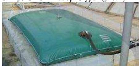
Рис. 1. Внешний вид полимерного эластичного резервуара

Полимерные эластичные резервуары представляют собой замкнутую оболочку в виде подушки с вмонтированной в нее арматурой (рис. 1).