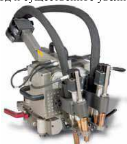
Рис. 1. Внешний вид головки П600

Головка П600 превосходит головки 200й серии по эффективности и продуктивности за счет использования двух дуг вместо одной, что обеспечивает более высокую производительность наплавки за один проход и существенное увеличение скорости сварки.