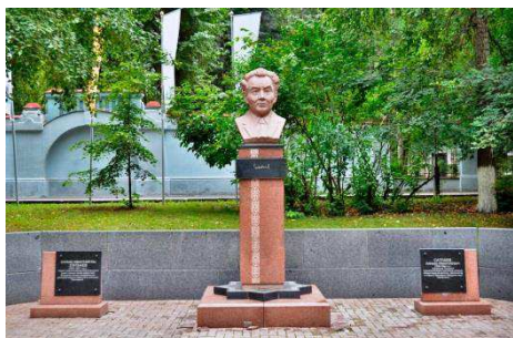
Памятник К.И. Сатпаеву на аллее геологов у горно-геологического корпуса ТПУ

Стратиформные месторождения типа медистых песчаников и сланцев являются одним из ведущих промышленно-генетических типов медных руд и играют определяющую роль в развитии медной промышленности Северной Америки, Центральной Африки, Европы и Казахстана. Как правило, это уникальные по запасам меди рудные объекты, при освоении которых формируются крупнейшие горно-металлургические комплексы. Инфраструктура последних определяет развитие и процветание целых регионов. В полной мере это относится к Жезказганскому месторождению и разрабатывающему его одноименному комбинату – флагману цветной металлургии Казахстана.