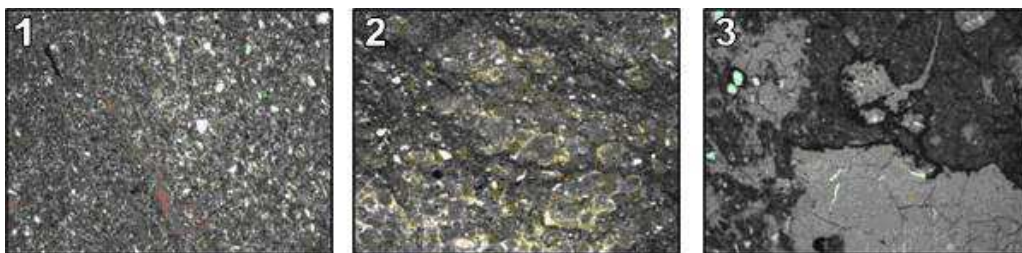
Рис. 2 Образец 231/27 – Слабо волнистая слоистость, известняк с примесью обломков кварца алевритовой размерности и глинистых минералов, органогенных остатков (1); Образец 232/18 — Известняк доломитизированный, хемогенно - органогенный, комковато - сгустковый, битуминозное вещество отмечается по тонким трещинкам, почти параллельно напластованию, неравномернотекстурированная структура (2); Образец 232/18 — Известняк кавернозный, перекристаллизованный. Битуминозное вещество приурочено к тонким трещинкам и пустотам (3)

Таким образом, результаты исследований свидетельствуют, что в отложениях среднего девона в сарагашское и бейское время существовали благоприятные фациальные условия для генерации и аккумуляции углеводородов. Однако, эродированность территории и отсутствие в отложениях бейской свиты непроницаемых покрышек способствовало миграции углеводородов.