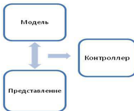
Рис.3 Паттерн MVC

Данный паттерн является архитектурным шаблоном, который описывает способ построения веб-приложения, определяя сферы ответственности и взаимодействия каждой из частей структуры приложения (рис. 3) [2].