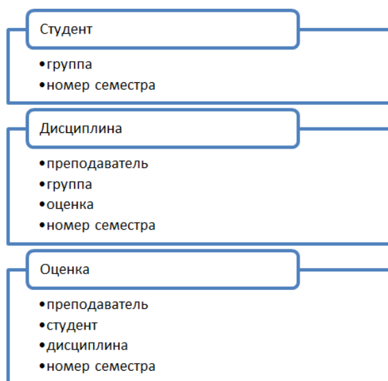
Рис. 2 Основные объекты системы

Данная система представляет собой веб-приложение. Такой способ реализации обеспечивает доступность для конечного пользователя и позволяет реализовать весь необходимый функционал как для анкетирования, так и для анализа данных. Для реализации системы был выбран язык скриптового программирования PHP , поддерживающий объекты и их атрибуты, приведенные на рисунке (рис. 2).