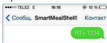
Рис 2. СМС сообщение для активации процесса нагрева

Шаг 3. Отправить СМС сообщение контейнеру со специальным кодом. (Рис. 2) Каждому контейнеру присвоен собственный номер.