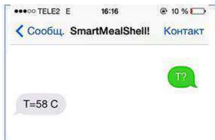
Рис. 3. СМС сообщение о запросе температуры

После того, как СМС сообщение отправлено, активируется процесс подогрева пищи. В любой момент времени вы можете проверить температуру пищи в контейнере. Для этого нужно отправить СМС со специальным кодом (о запросе температуры) и вы ответном сообщении вам придет информация о температуре внутри контейнера (Рис.3).