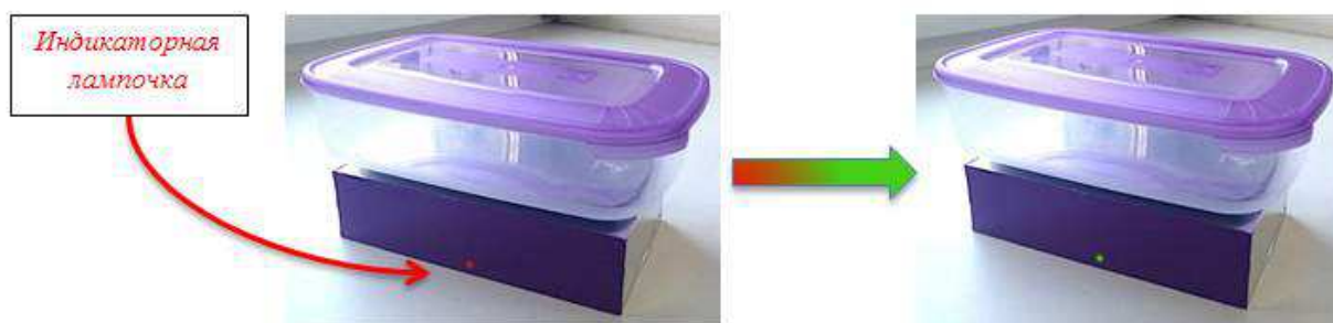
Рис 1. Процесс включения контейнера

Шаг 2. Дождаться момента, когда GSM модуль поймает сеть – индикаторная лампочка загорится зеленым светом (Рис. 1)