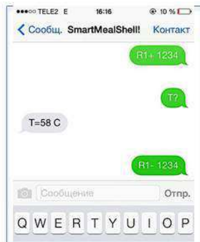
Рис. 4. Преждевременное отключение контейнера

Идея СМС - технологий может завоевать популярность не только у студентов, но и у людей, ведущих