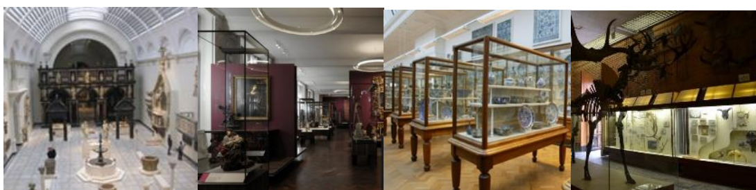
А) Подиумы; Б) Стенды; В) Деревянные витрины Г) Витрины с освещением

Экспозиционное оборудование в данном музее сочетается с экспозицией, много высоких стеклянных витрин и подиумов для наилучшего обзора экспонатов. Наиболее часто встречаются витрины, подиумы и стенды. Тексты в экспозиции музея, этикетки, как и заглавные тексты, являются частью оборудования и выполнены в едином стиле и цветовой гамме.