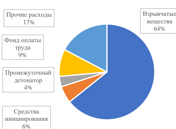
Рис. 3. Структура удельных затрат при производстве взрывных работ