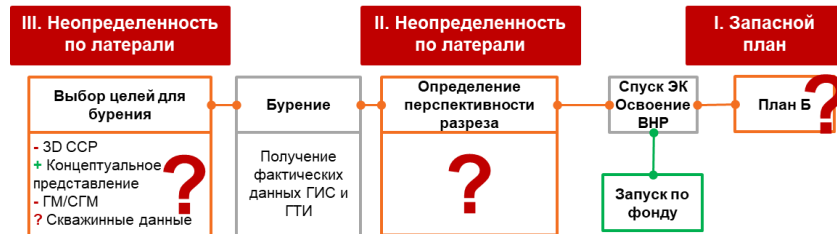
Рис. 2 Дерево неопределенностей проекта бурения на фундамент

Таким образом, перед геологами предстали 3 вызова эффективного бурения на фундамент: