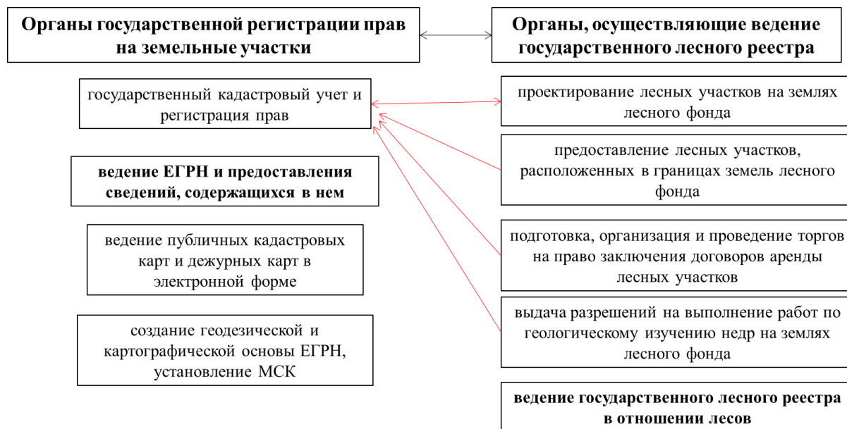
Рис. 2 Функциональная связь органов, уполномоченных на ведение ЕГРН и ГЛР [2]

Взаимосвязь между функциями уполномоченных на ведение таких реестров органов представлена на рисунке 2.