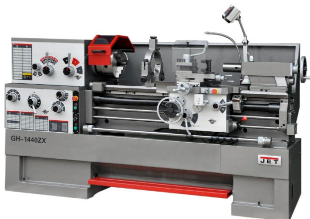
Рис. 1. JET GH-1440ZX.

За основу был взят уже готовый рабочий токарный станок фирмы JET модель GH-1440ZX (Рис. 1). Особенности этого станка по заявлению завода изготовителя являются: «Компактный размер с большой возможностью обработки. Проходное отверстие в шпинделе 80 мм. С помощью съёмного мостика возможно повысить диапазон обрабатываемой детали».