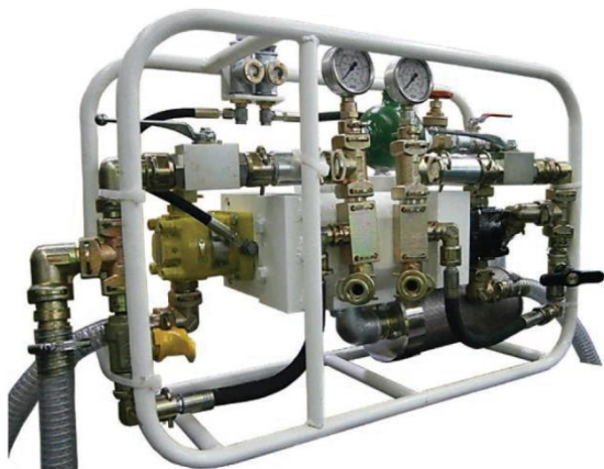
Рис. 2. Общий вид пневматического насоса SK90 1:1 Fig. 2. Pneumatic pump SK90 1:1 general view

Анализ опыта применения скрепляющих составов при ремонте и восстановлении горных выработок показывает, что для составов с двумя компонентами, в том числе «Беведол-Беведан», широкое применение получают пневматические двухкомпонентные насосы типа SK90 1:1 (рис. 2). В табл. 2 приведены основные технические характеристики насоса SK90 1:1.