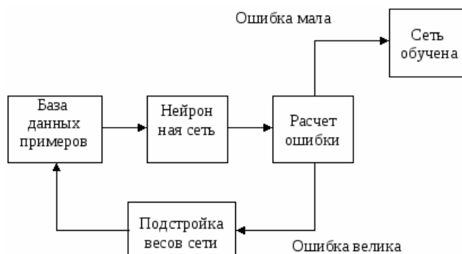
Рис. 3. Этапы обучения нейронной сети

На пятом этапе происходит конструирование и обучение сети (рис. 3)