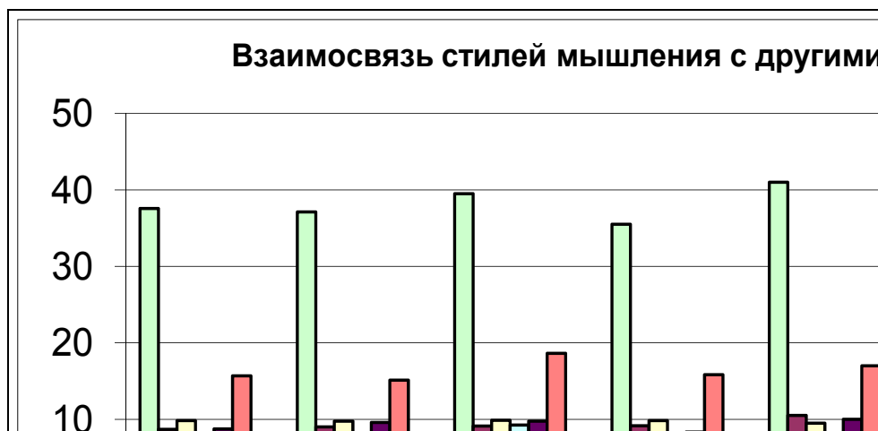
Рис. 1. Взаимосвязь стилей мышления с другими показателями

Мы провели анкетирование студентов 1 и 2 курса бакалавриата «прикладная информатика» по следующим показателям: творческий потенциал, логичность, уровень интеллекта, пространственное и образное мышление, функциональная симметрия–асимметрия полушарий головного мозга, стили мышления. Рассмотрим взаимосвязь стилей мышлений с остальными показателями. Творческий потенциал и логичность преобладает у синтезаторов, пространственное и образное мышление – у прагматиков, уровень интеллекта – у аналитиков.