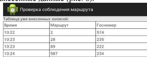
Рис. 6. Часть таблицы с внесенными данными о проверках

При выходе из окна добавления проверки контролеру предоставляется возможность посмотреть все внесенные данные (рис. 6).