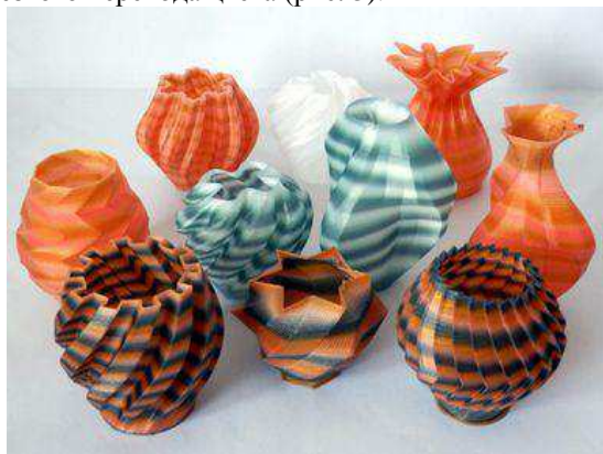
Рис. 3. Полноцветная печать

О полноцветной печати дома пока можно забыть. Печать двумя (или более) цветами возможна, но нужно либо несколько печатающих головок, либо менять прутки во время печати, либо красить сам пруток. Есть эксперименты по смешиванию цветов, но они не позволяют получить резкого перехода цвета (рис. 3).