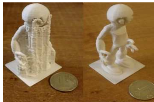
Рис. 2. Печать дополнительных опор

Ограничение в размерах и геометрии объекта. Если модель имеет нависающие элементы, то необходимо печатать поддерживающие конструкции (рис. 2). Поддержки достаточно сложно удалить, если они печатаются тем же материалом, что и основная модель. Это портит и так не идеальную поверхность.