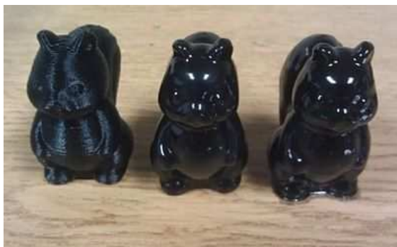
Рис. 4. Варианты обработки поверхности

Поверхность напечатанной модели совсем не идеальна: заусеницы, ребристость, наплывы. Для сглаживания поверхности применяют механическую и/или химическую обработку (рис. 4).