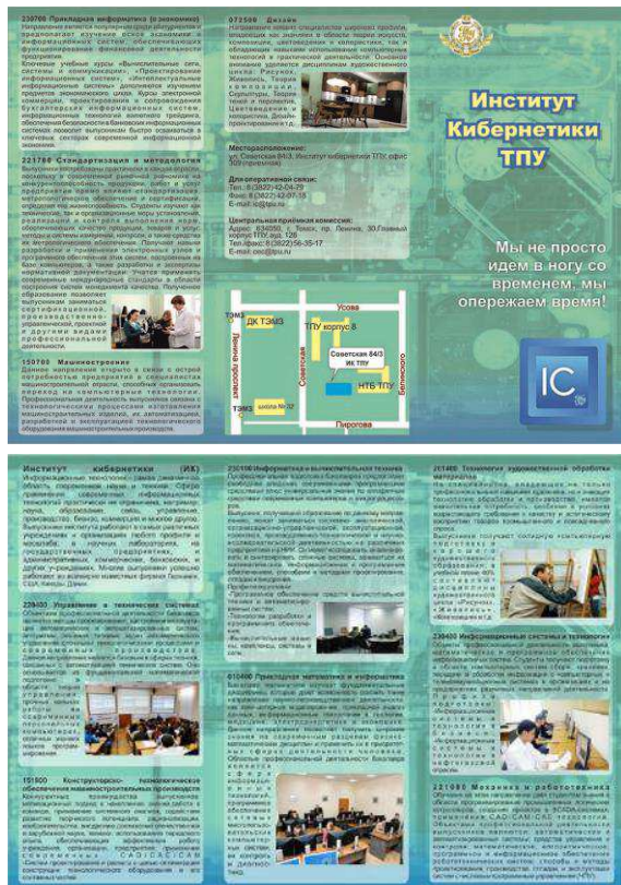
Рис. 4. Вариант № 4

В варианте 3 подложка соответствует заданной тематике, выбрана приемлемая палитра цветов, но верстка текстовых блоков выполнена не качественно, поскольку нет четкой структуры документа.