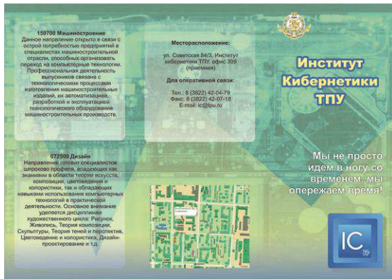
Рис. 3. Вариант № 3

В варианте 3 подложка соответствует заданной тематике, выбрана приемлемая палитра цветов, но верстка текстовых блоков выполнена не качественно, поскольку нет четкой структуры документа.