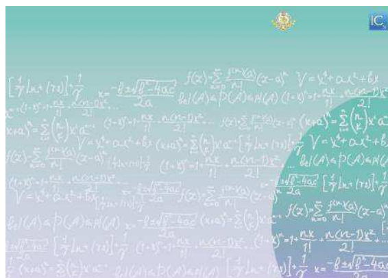
Рис. 1. Вариант № 1

Первым этапом работы в графическом редакторе являлось создание подложки для буклета. Отталкиваясь от бирюзовых тонов на сайте ИК и в его логотипе был создан первый вариант подложки.