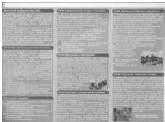
Рис. 2. Обратная сторона буклета ИК 2012 года

Буклет состоит из общей информации об институте, его направлениях, местонахождении ИК, e-mail адреса, телефона. В процессе разработки возникла задача с правильным выбором формы буклета, цветового тона и удобным расположением информации на ней. Для решения этой задачи потребовалось изучить более ранние версии буклета, а именно: его форму, цвет и информацию, внесенную в него.