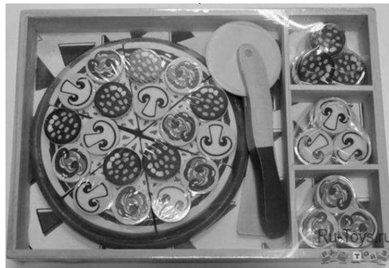
Рис. 1. Динамическая игрушка «Пицца с грибами»

Кроме того, неоценимую помощь в развитии мелкой моторики у детей могут оказать всевозможные конструкторы, которые будут не только увлекательным занятием для вашего малыша, но и наряду с моторикой существенно расширят его мировосприятие, понимание объема и перспективы. Начинать можно с самых простых конструкторов, состоящих из кубиков и других геометрических фигур, постепенно усложняя задачу, меняя конструкторы на более сложные.