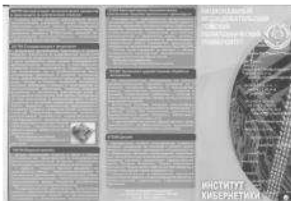
Рис. 1. Буклет ИК 2012 года

Буклет (англ. booklet) – вид печатной продукции, характерный для рекламной полиграфии, имеющей внешнюю схожесть с брошюрой, но обычно более сложной конструкции и проработанного дизайна. Представляет собой листы, скрепленные в корешке, или сфальцованный в два и более сгибов лист бумаги, на обеих сторонах которого размещена текстовая или графическая информация. Традиционно буклеты изготавливаются на бумаге из листа формата А4 или меньше (рис. 1).