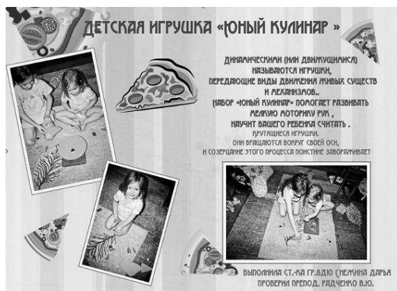
Рис. 2. Проект динамической игрушки «Юный кулинар»

Двух-, трехлетний ребенок уже все хорошо понимает, но еще затрудняется разговаривать длинными предложениями. Чтобы лучше развить его речь, нужны развивающие игры такие, как «Юный кулинар».