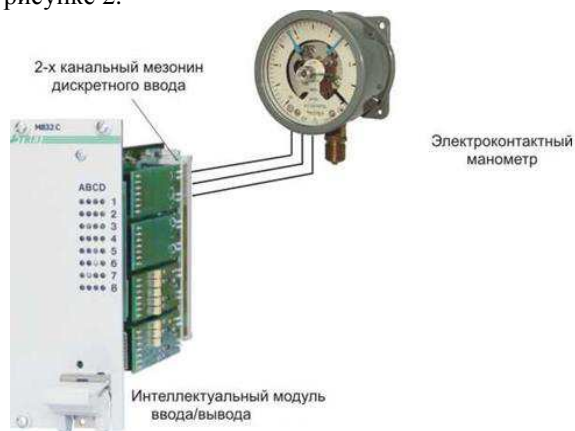
Рис. 2. Пример подключения датчика к дискретному модулю

Датчики температуры ТСМ-50М, датчики предельного уровня ДПУ-6, датчики уровня ультразвуковые ДУУ-6, электроконтактные манометры, датчики давления «Метран» через барьеры искрозащиты подключаются к интеллектуальному модулю ввода/вывода M932C2. Пример подключения интеллектуального модуля манометра на выходе насосов дожимной насосной станции показан на рисунке 2.