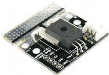
Рис. 2. Сенсор тока ACS758