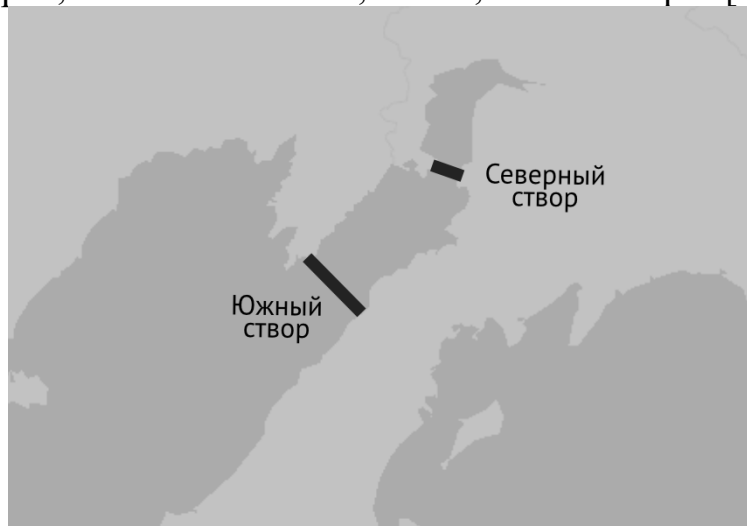
Рис.3. ПЭС-1 и ПЭС-2 (Северный и Южный створы)

В 1970-е годы установленная мощность Пенжинской ПЭС составляла до 100 ГВт. Данная цифра соответствует около 40% общей установленной мощности электростанций единой энергосистемы России. Согласно оценке института «Гидропроект» общая стоимость проекта была оценена более чем в $200 млрд. По заключению института в Пенжинской губе могут быть построены две крупные приливные электростанции, стоимость Пенжинской ПЭС-1 (Северный створ) (рис.3) должна была составить $60 млрд, ПЭС-2 (Южный створ) (рис.3) — $200 млрд. С целью осуществления проекта планировалось создать международный консорциум, который также включает энергопотребителей из других стран, таких как Япония, Китай, Южная Корея [6].