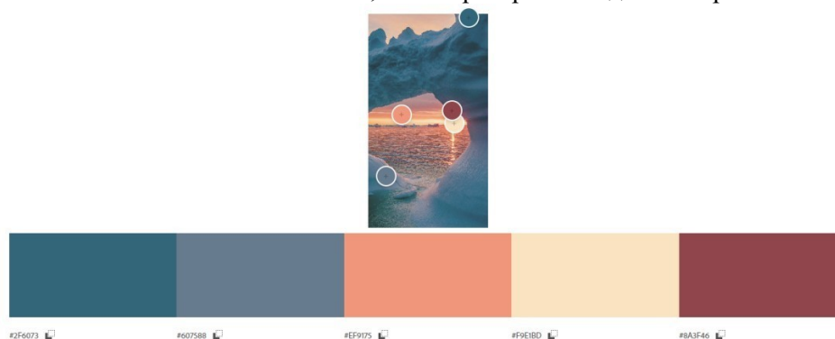
Рис. 2. Художественный образ

Цветовое решение игрового комплекса основывается на психологии цвета. С помощью ресурса Adobe Color была выявлена сплит-комплементарная цветовая гармония, которая стала основой цветового решения и представлена на рисунке 2. Белый – основной цвет объекта - символизирует чистоту и доброту, также белый цвет всегда помогает быть в тонусе. Синий цвет и его оттенки успокаивает и немного уменьшает активность, данный цвет часто используется в детских интерьерах, так как благоприятно способствует работе мозга и позволяет ребенку не перевозбуждаться в процессе познавательной деятельности. Оранжевый цвет в психологии ассоциируется с жизнерадостностью, открытостью, здоровыми эмоциональными переживаниями. По данным исследований, оранжевый цвет оказывает некоторое возбуждающее и тонизирующее действие на ЦНС человека. Использование бордовых оттенков нельзя допускать там, где людям нужен душевный покой, например, в больницах. Однако, данный цвет прекрасно подходит для того, чтобы создать необходимое повышение активности у детей и привлечь внимание к тем элементам, за которые ребенок должен бороться.