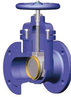
Рисунок 1 – Запорная арматура с задвижкой

Регулируемый электропривод является самым распространенным видом приводов во всех областях промышленности. В целом, регулируемый электропривод представляет собой систему, в которой выходная скорость движения исполнительного органа изменяется, соответствуя требованиям технологического процесса, и которая состоит из: двигателя, преобразующих, измерительных и коммутирующих устройств.