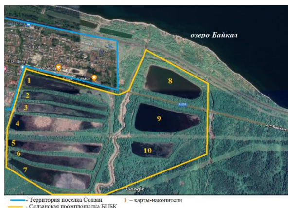
Рис. 1. Космический снимок Солзанской промплощадки БЦБК, на которой расположены карты-накопители № 1–10

Наиболее опасными для социально-экологического благополучия региона являются накопленные отходы прошлых лет БЦБК, размещенные на южном берегу озера Байкал (расстояние до озера 200 м) и прилегающие к населенным пунктам, например, к поселку Солзан (расстояние до поселка 50 м) с численностью около 800 человек. Ситуация осложнена тем, что район расположения лигнинсодержащих отходов, хранящихся в картах-накопителях (рис. 1), относится к территории, на которой очень высокий риск возникновения селей и землетрясений, что периодически и происходит.