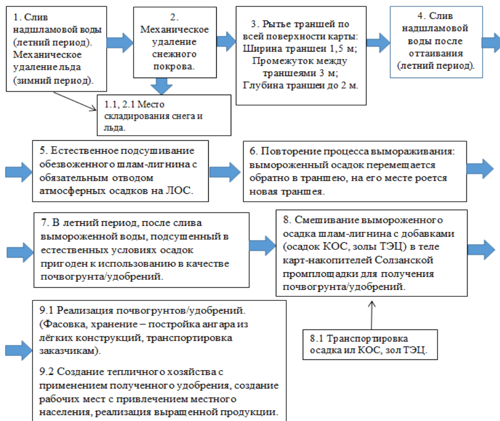
Рис. 3. Укрупненная блок-схема предлагаемого технологического процесса Fig. 3. Enlarged block diagram of the proposed technological process

Таким образом, процесс вымораживания проводится в зимний период времени при наступлении устойчивых отрицательных температур, ориентировочно в середине ноября. При наличии льда над осадком более 10 см его необходимо удалять ледорубной машиной типа ЛУ-900 и дожидаться промерзания осадка на глубину 10–20 см. После этого проводится механическая уборка снега с поверхности карт вездеходом-амфибией типа Пелец. При промерзании поверхности осадка на глубину 20–30 см для уборки снега может быть использован вездеход типа АРГО. За зимний период времени в районе Южного Прибайкалья в среднем происходит 7–8 сильных снегопадов, с образованием снежного покрова 50 см и более, который необходимо также циклично удалять с поверхности карт.