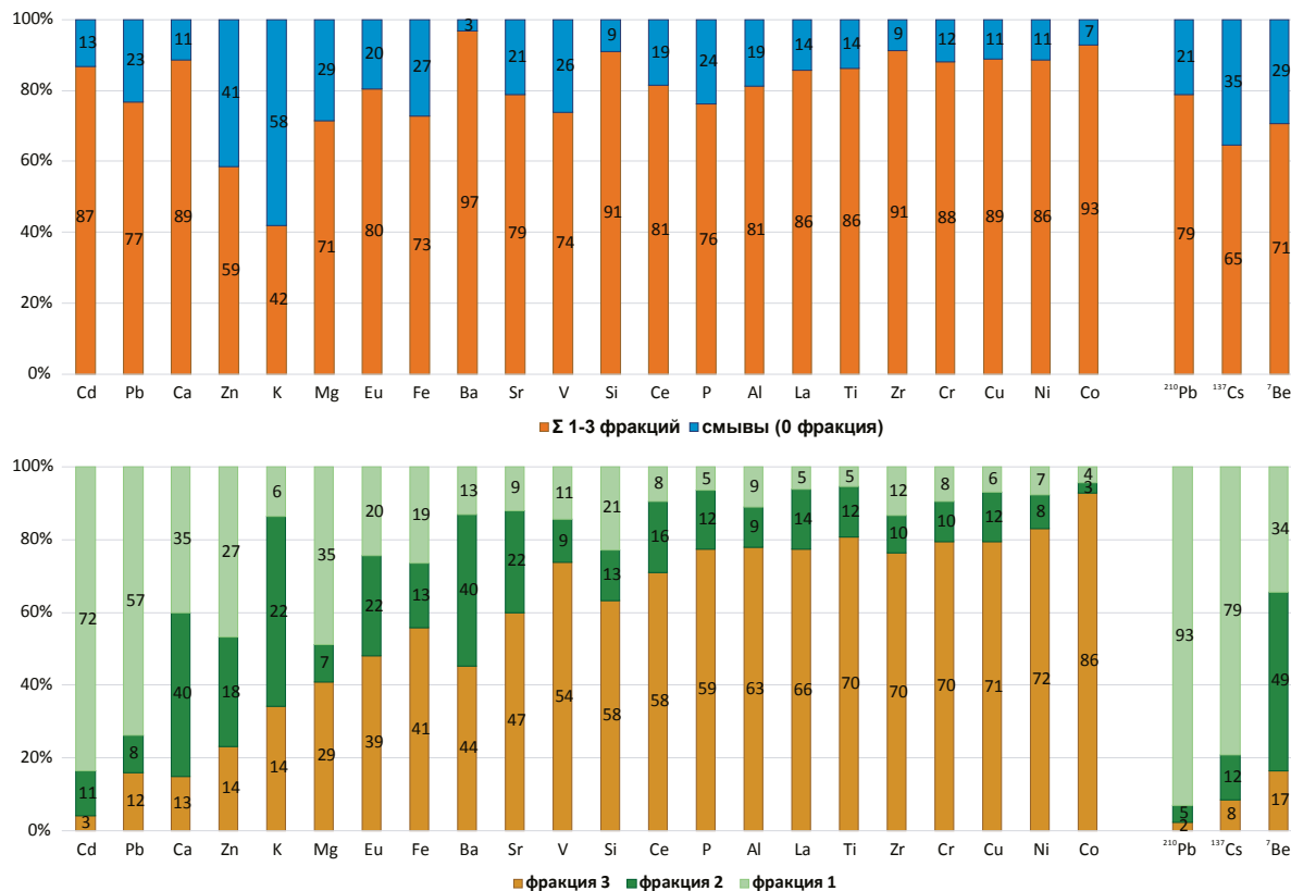
Рис. 2. Распределение элементов и изотопов между пылевой фракцией и фракциями биомассы

Помимо стабильных элементов, мы рассматривали распределение по биологическим фракциям трех изотопов: ^7\text{Be} , ^{137}\text{Cs} , ^{210}\text{Pb} . Естественные изотопы ^7\text{Be} и ^{210}\text{Pb} образуются в атмосфере и являются индикаторами атмосферных выпадений. Поступление искусственного изотопа ^{137}\text{Cs} в лишайники в настоящее время возможно только в связи с вторичным перераспределением через процесс выветривания.