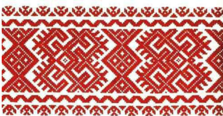
Рисунок 2. Орнамент на примере декоративных элементов

Так для основной формы посуды, была взята традиционная форма русско-народных ковшей, горшков, утятниц для горячей пищи. В основе приборов и стаканов лежит особенности русско-народных деревянных ложек, которые имели вытянутую рукоять, скругленный, выпуклый кончик и небольшое черпало округлой формы. В качестве формообразования от фрактальных структур, был разработан дизайн декоративных элементов для посуды, которые имеют металлическое основание внутри прозрачного материала. Элементы представляют собой круговую композицию русско-народного орнамента, который по традициям народа считался оберегом от сглаза и порчи, что могло накладываться на пищу (Рисунок 2).