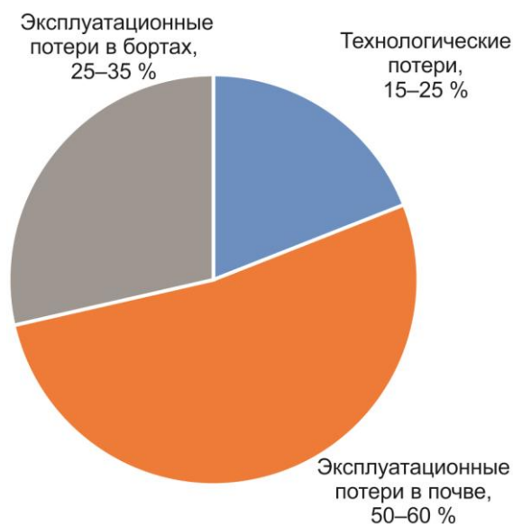
Рис. 2. Структура потерь при первичной отработке месторождений дражным способом

рождений этого района представлены отвально-целиковым комплексом, где осуществляется одно-временная переработка как отвалов вскрыши, так и запасов в бортах дражных разрезов [36].