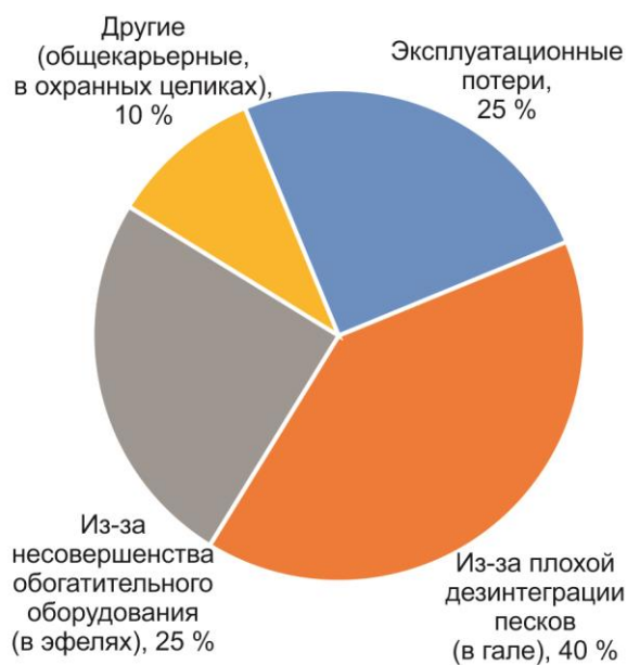
Рис. 1. Структура потерь на глинистых россыпях

ненты, сосредоточенные в них, высвобождаются и извлекаются при повторном дражировании [30].