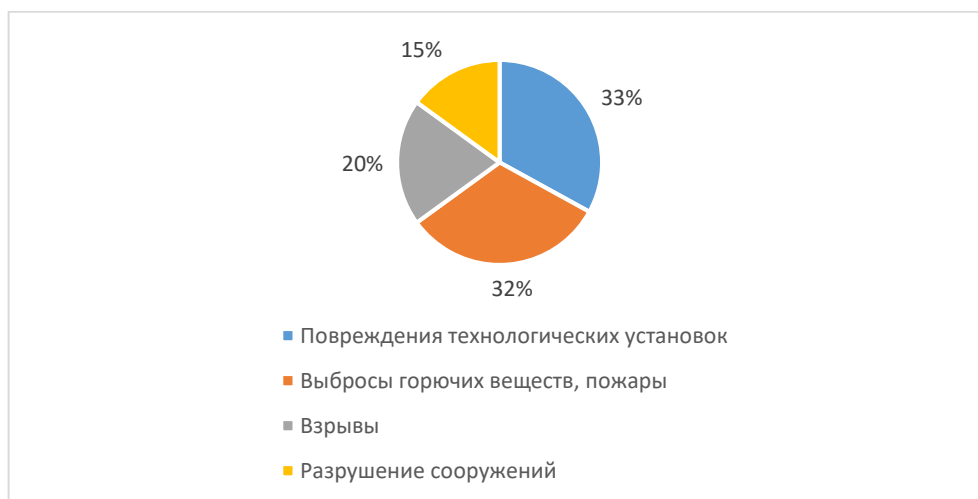
Рисунок 1 – Общая статистика аварий на объектах нефтепромышленного комплекса

На рисунке 1 представлена общая статистика аварий на объектах нефтепромышленного комплекса.