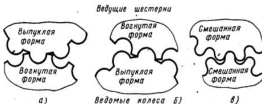
Рис. 1. Профили зубьев в зацеплении Новикова

Зацепление Новикова, круговинтовое зацепление, передача Новикова – механическая передача, альтернативный эвольвентному тип зацепления, предложенный советским инженером М.Л. Новиковым в 1954 году для зубчатых передач. Зубья колёс в торцевом сечении очерчены окружностями близких радиусов. Площадка контакта зубьев перемещается не по профилю зуба, как в прямозубом эвольвентном зацеплении, а вдоль него (рис. 1). Угол давления и скорость перемещения не изменяется.