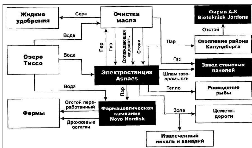
Рис. 3. Система промышленного симбиоза города Калундборг [6]

3. Промышленный симбиоз – это добровольное сотрудничество предприятий с целью оптимизации производственных издержек путем использования побочных продуктов и отходов одних предприятий в качестве сырья другими, а также совместное потребление информационных, энергетических, водных и других ресурсов. Самым известным примером является промышленный симбиоз, созданный в городе Калундборг в Дании. Начиная с 1961 года и в течение 30 лет в небольшом районе на берегу моря образовалась сеть материальных и энергетических потоков между предприятиями, жилыми зданиями и сельскохозяйственными фермами. Первоначальным мотивом для организации такой системы было желание предпринимателей снизить себестоимость продукции за счёт использования отходов и получить больше прибыли. Постепенно руководители предприятий и муниципалитет осознали, что наряду с увеличением прибыли предприятий уменьшился ущерб от загрязнения окружающей среды [5].