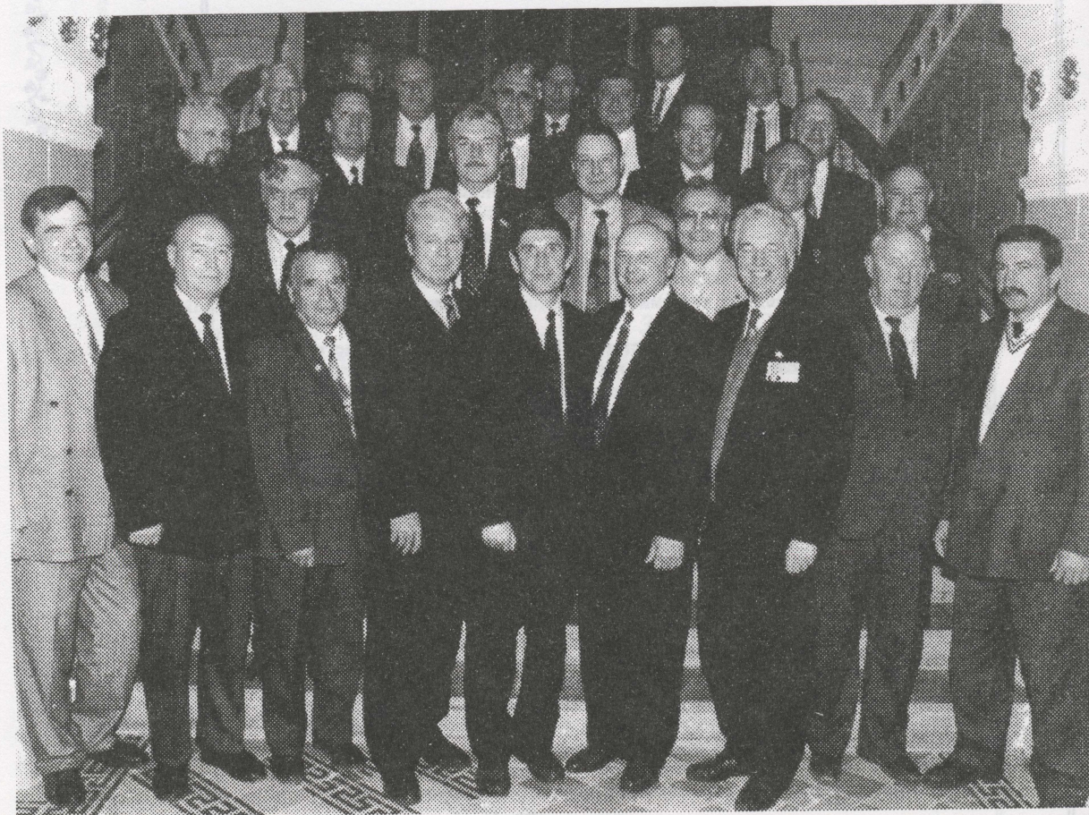
Члены Совета попечителей и высокие гости ТПУ на праздновании юбилея