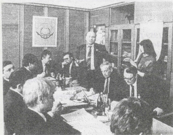
На заседании Совета Попечителей ТПУ.

Презентация стала как бы прелюдией к предстоящему празднованию 100-летия Томского политехнического университета.