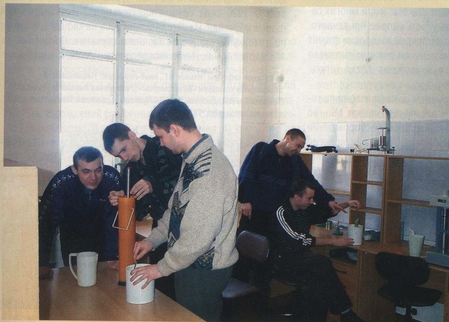
Студенты гр.2882 выполняют лабораторную работу